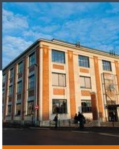
IUT de Blois