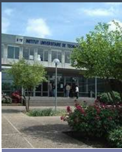
IUT de Tours